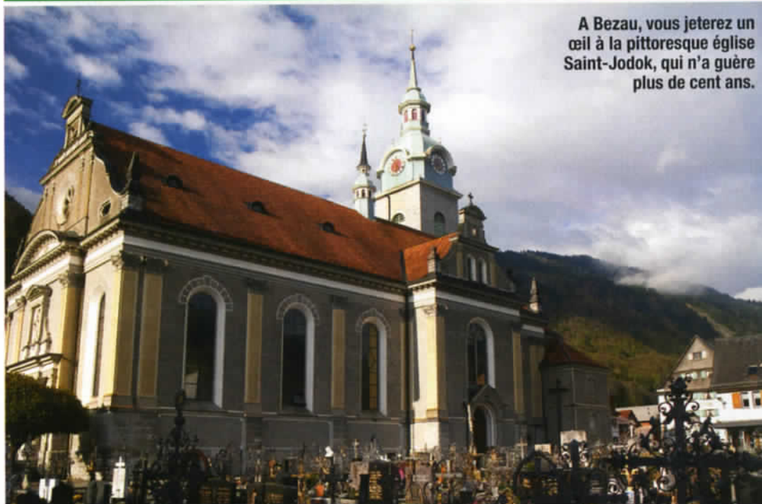
A Bezau, vous jeterez un œil à la pittoresque église Saint-Jodok, qui n'a guère plus de cent ans.