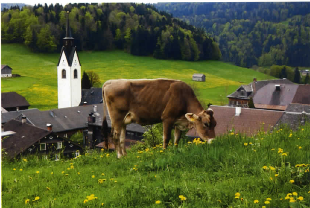
Le petit village de Schwarzenberg est un vrai conservatoire du chalet traditionnel. Et, comme il se doit, les vaches font partie du décor...