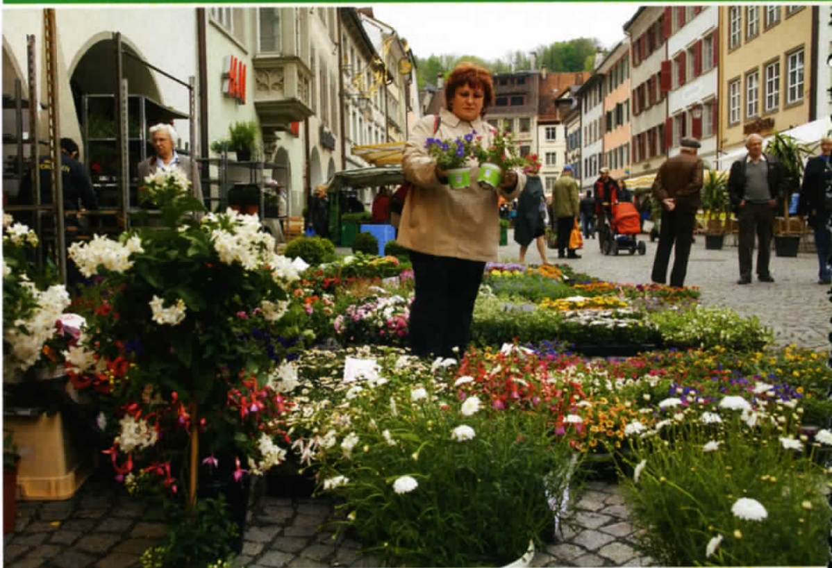
Pas moins de trois marchés hebdomadaires animent la Markt Platz de Feldkirch.

Puis, à Feldkirch, ville de caractère, une promenade pédestre permet d'aller de monument en monument, parmi lesquels la cathédrale Saint-Nicolas, la Tour des chats, l'Hôtel de ville orné de fresques murales, jusqu'à atteindre le château de Chattenburg. Edifié vers 1230 sous le règne